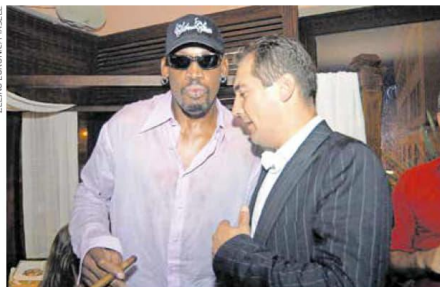
DENNIS RODMAN za boravka u Zagrebu, a bilo je to 2003. godine, zabavljao se i u društvu nogometaša Igora Štimca

Po sutrašnjem povratku među svoje Bullse Rodmana je dočekala kazna zbog propuštanja treninga, da bi svoju najbolju utakmicu serije odigrao upravo u idućoj utakmici. Igrajući 29 minuta, "Dennis the Menace" uhvatio je 14 skokova, što je bio vrijedan doprinos pobjedi Chicaga s 86:82 za vodstvo u seriji od 3-1. Na kraju su bikovi osvojili naslov u šest utakmica.